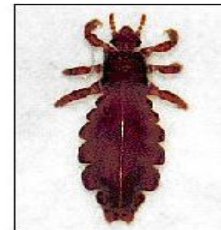
実際には成虫は黒みがかった灰色に見えます。とても早く動き回ります。大きさは2~3mm